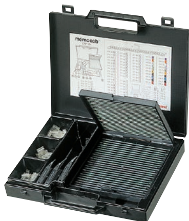
0 379 99