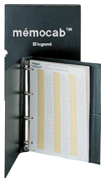
0 379 97 + 0 379 96