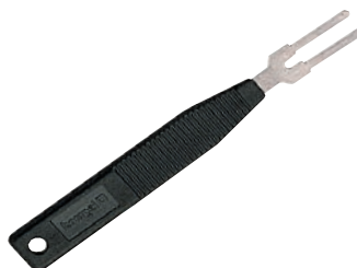
0 379 89