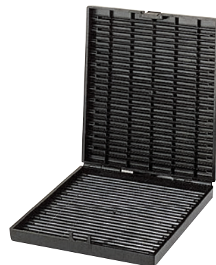
0 379 91